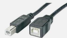
USB-B (Vigil X700®)

Le logiciel AcurGuard est conçu pour être simple et intuitif. Il permet d'avoir une visibilité sur les activités de gardiennage au sein de votre entreprise à travers des rapports des plus simples aux plus spécifiques.